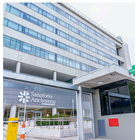
Sanatorio Anchorena San Martín