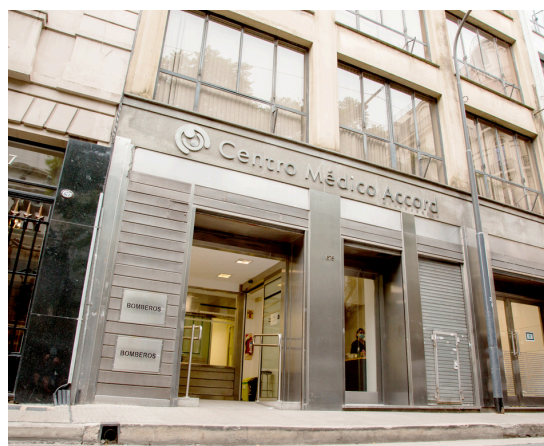
Centro Médico Anchorena Microcentro (ex Cemac)