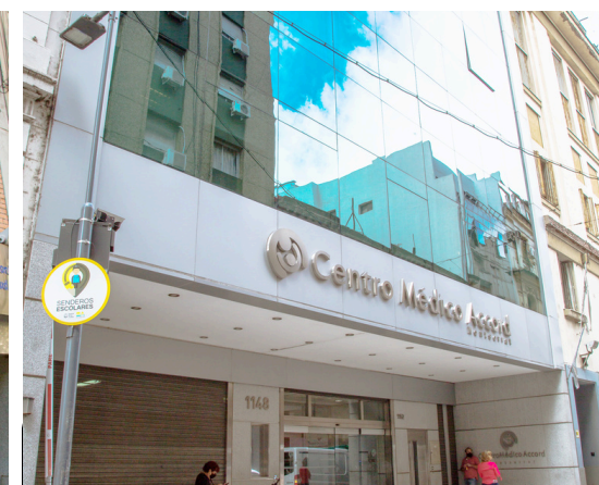
Centro Médico Anchorena Montserrat (ex Cemac)