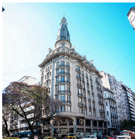
Sanatorio Anchorena del Callao