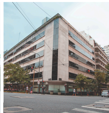
Sanatorio Anchorena Recoleta