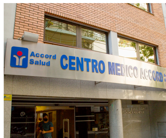
Centro Médico Anchorena Recoleta (ex Cemac)