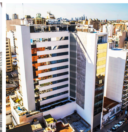
Sanatorio Anchorena Itoiz