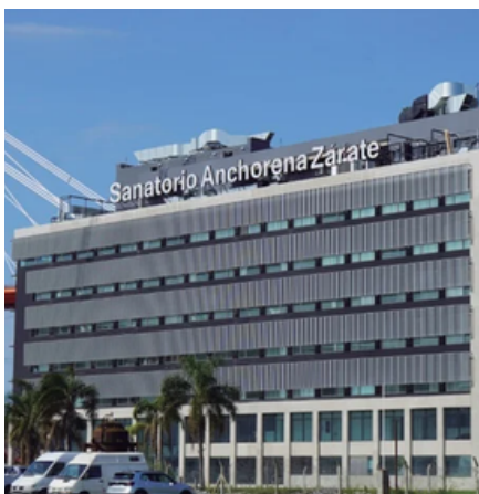
Sanatorio Anchorena Zárate