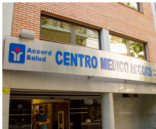
Centro Médico Anchorena Recoleta (ex Cemac)