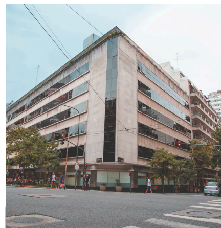
Sanatorio Anchorena Recoleta