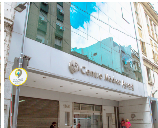
Centro Médico Anchorena Montserrat (ex Cemac)